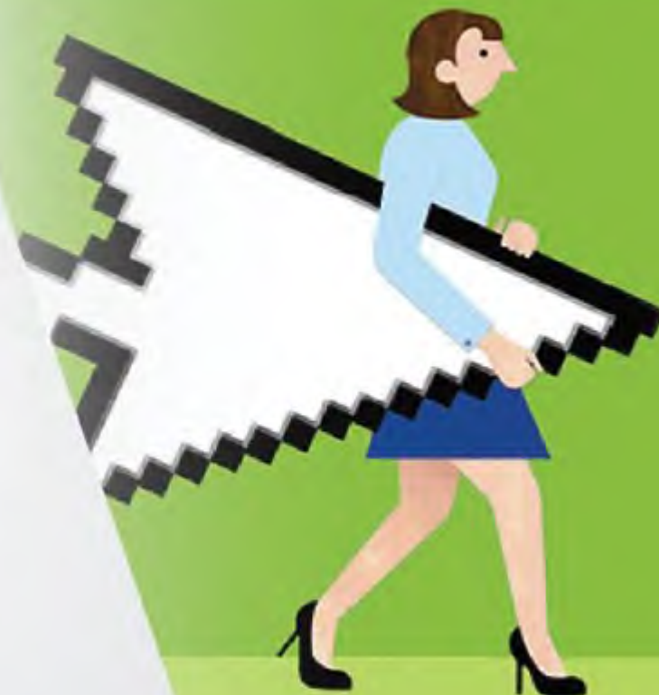
Ilustração: Gemma Robnson

Inclusive a criança, de cometer ato infracional, passíveis de aplicação de medidas sócio-educativas , tais como: advertência, obrigação de reparar o dano, prestação de serviços a comunidade, inserção em regime de semi- liberdade, internação em estabelecimento educacional e outras previstas nos artigos 101 e 105 do mesmo Estatuto.